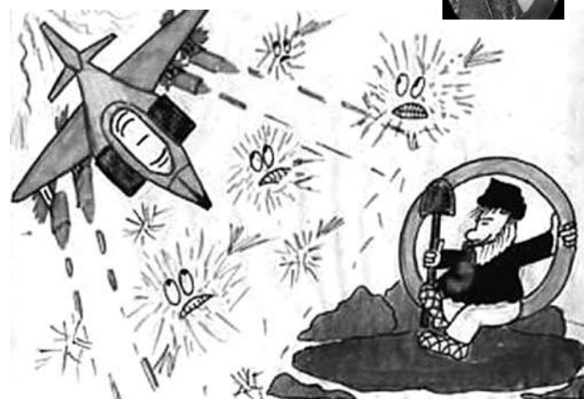
А вот таким детским «видением» браздов, ямщика и кибитки делятся друг с другом пользователи Интернета