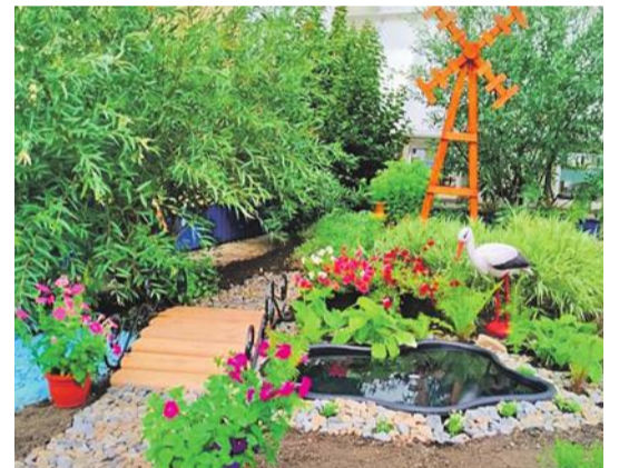
Рождественская школа Валуйского городского округа