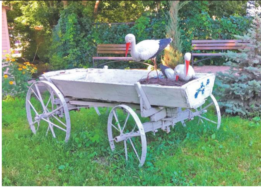
Центр образования № 1 г. Белгорода