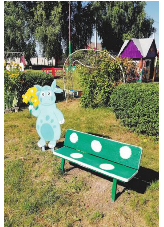
Детсад № 4 с. Алексеевка Корочанского района