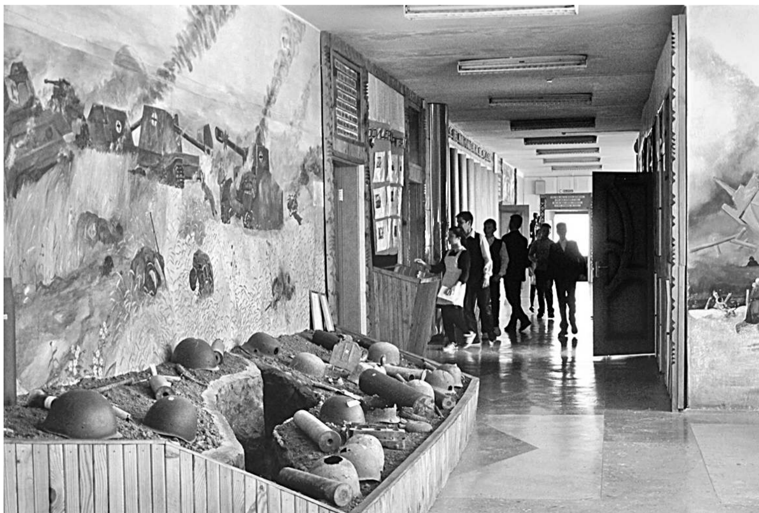
Школьный музей Великой Отечественной войны