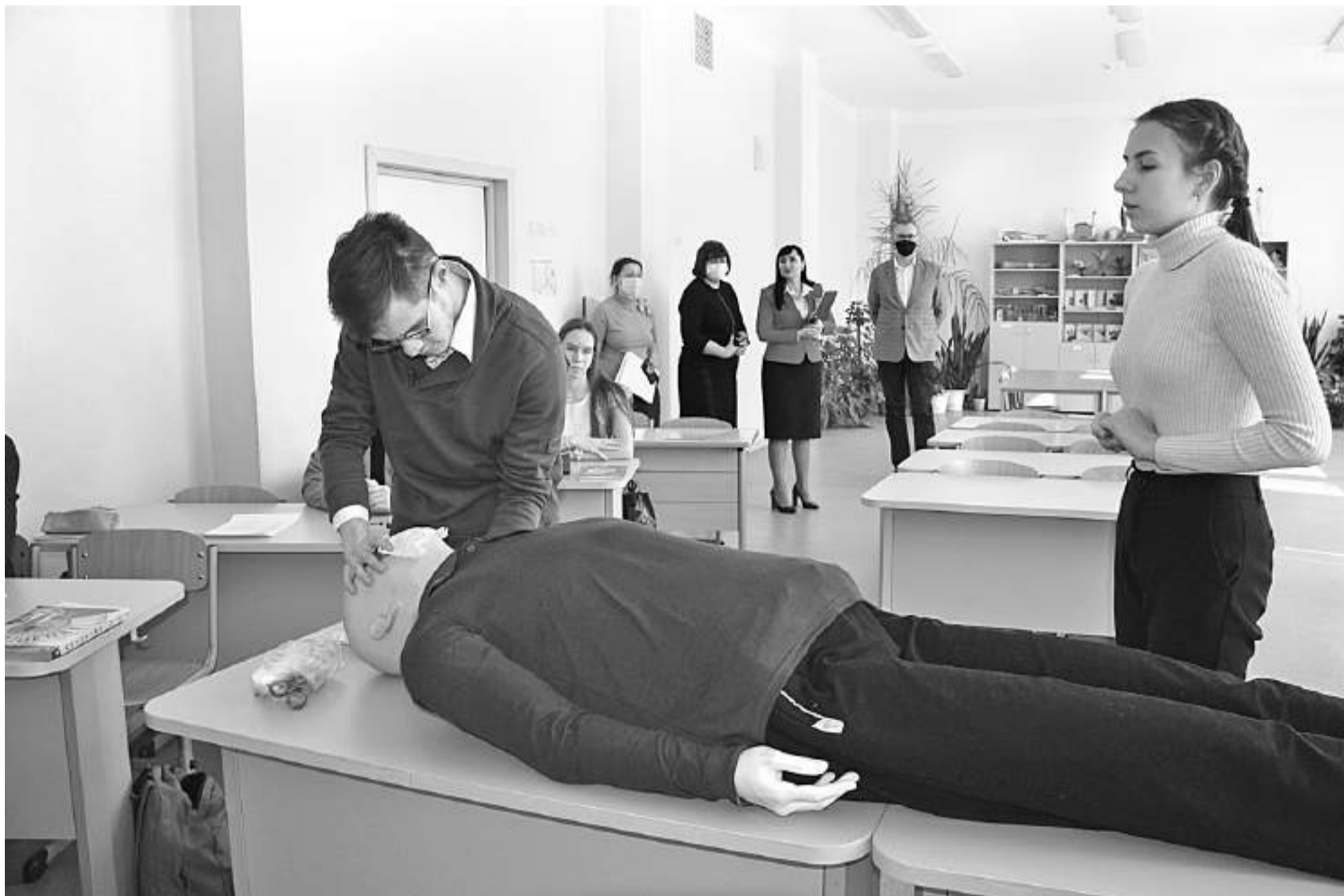
Урок биологии в медицинском классе Центра образования № 15 «Луч»

ПОЧЕМУ СЕЙЧАС В ШКОЛАХ НЕДОСТАТОЧНО ПРОСТО ПРОФИЛЬНОГО ОБУЧЕНИЯ