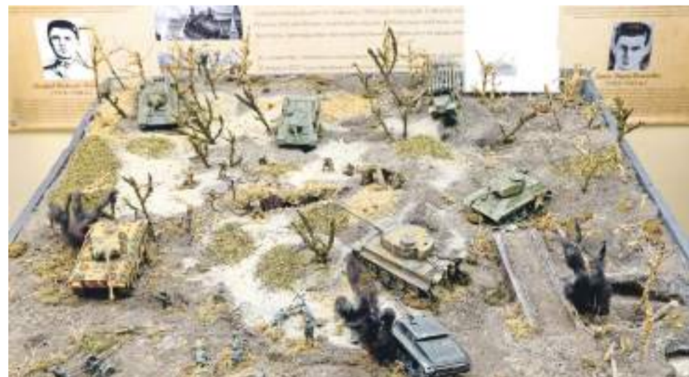
Макет «Танковая дуэль»