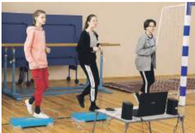
Для старшеклассников Хотмыжской школы на физкультуре и внеурочке проводят занятия по степ-аэробике