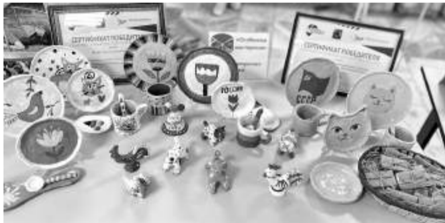
Работы учащихся гончарной мастерской «РАС Прекрасная керамика» Центра внешкольной работы г. Губкина

Первая ресурсная группа открылась в 2017–2018 учебном году в детском саду № 29 «Золушка». В текущем году ресурсные группы функционируют уже в трёх детских садах. Образование получают 15 детей.