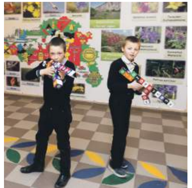
Игровая подвижная зона — любимое место учеников начальных классов Хотмыжской школы