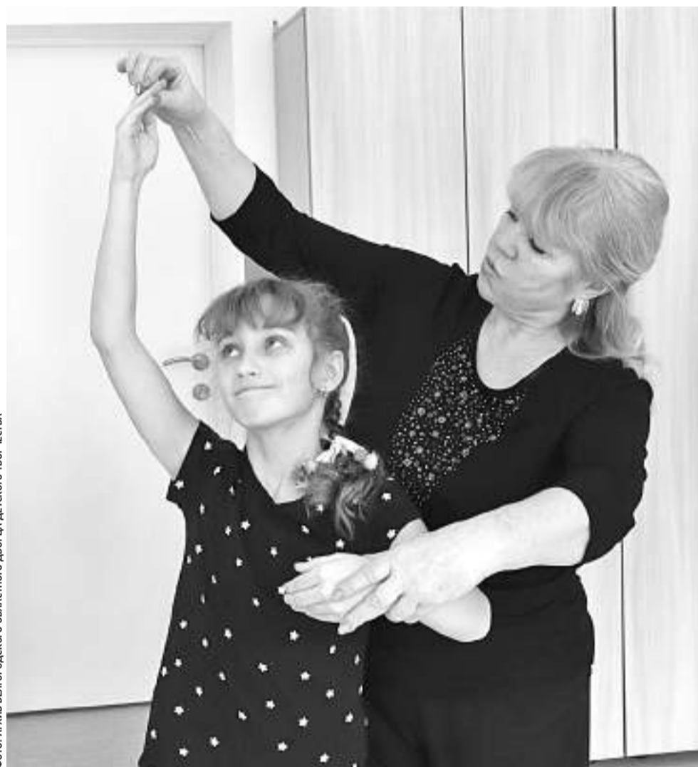
Занятия в хореографической студии для детей с РАС Белгородского областного дворца детского творчества

— Конечно. Мы провели мониторинг кадрового потенциала, педагогические работники проходят курсы и обучающие семинары на базе федеральных и региональных организаций высшего образования. В 2020 году обучили 91 педагога, 21 из них прошёл дистанционное обучение в Московском государственном психолого-педагогическом университете. Четыре педагога прошли дистанционные курсы повышения квалификации в институте коррекционной педагогики Российской академии образования по теме