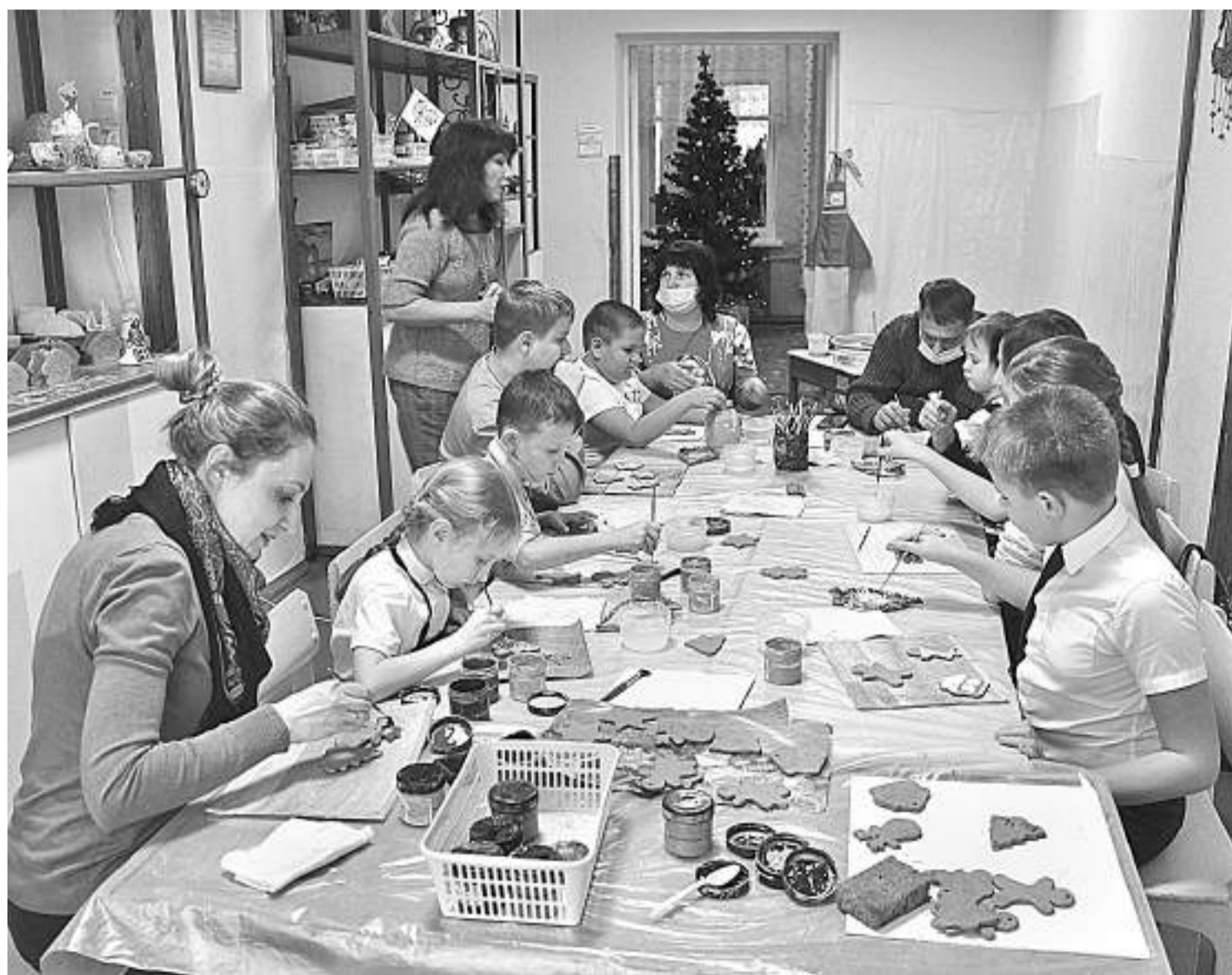
Занятие в гончарной мастерской «РАСпрекрасная керамика» в Губкинском центре внешкольной работы

На заключительный этап фестиваля было представлено 103 конкурсных видеоматериала по декоративно-прикладному, художественному и театральному творчеству, хореографии, вокалу, свободному творчеству. Члены жюри отметили высокий уровень исполнительского мастерства, творческий подход, разноплановый репертуар участников. Всех детей наградили дипломами, медалями, книгами.