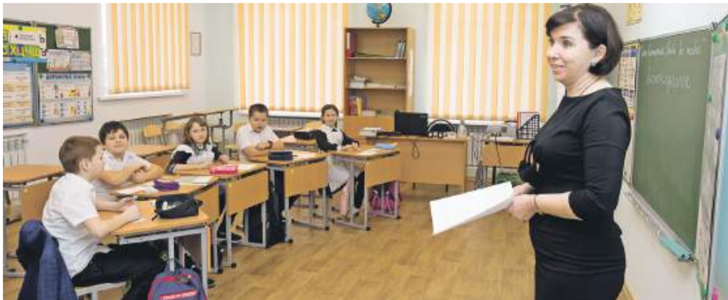
Классы Борисовской начальной школы им. Кирова маленькие — по 5–6 человек, так что можно поэкспериментировать с расстановкой парт, к примеру, поставить их полукругом

В школе есть телестудия «Репортёр» и уже 21-й год подряд неизменно раз в месяц выпускается газета «Мир детства». Кстати, в ближайшее время планируют выкладывать в открытый доступ электронную версию. С оперативностью ребята на «ты». Не успели мы посмотреть хореографический класс, мини-актовый зал, литературную гостиную, как на школьной страничке в соцсети «ВКонтакте» уже красовалось: «Сегодня в стенах нашей школы мы встречаем корреспондентов газеты «Доброжелательная школа Бе-