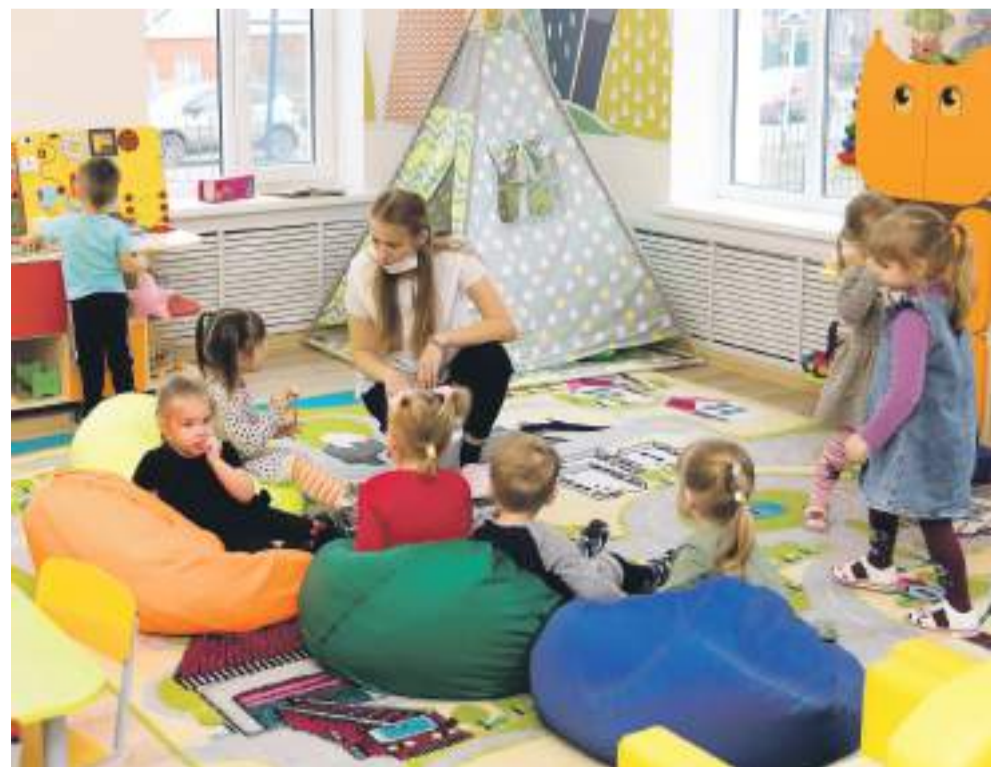
Игровая комната детсадовцев ясельной группы при Борисовской начальной школе им. Кирова