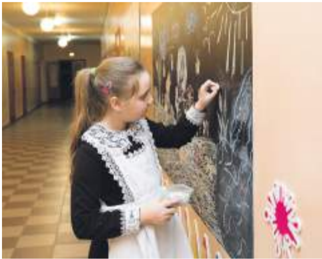
Ученики начальных классов Хотмыжской школы обожают рисовать мелками на досках в рекреации

КАК В БОРИСОВСКИХ СЕЛЬСКИХ ШКОЛАХ ИДУТ В НОГУ СО ВРЕМЕНЕМ