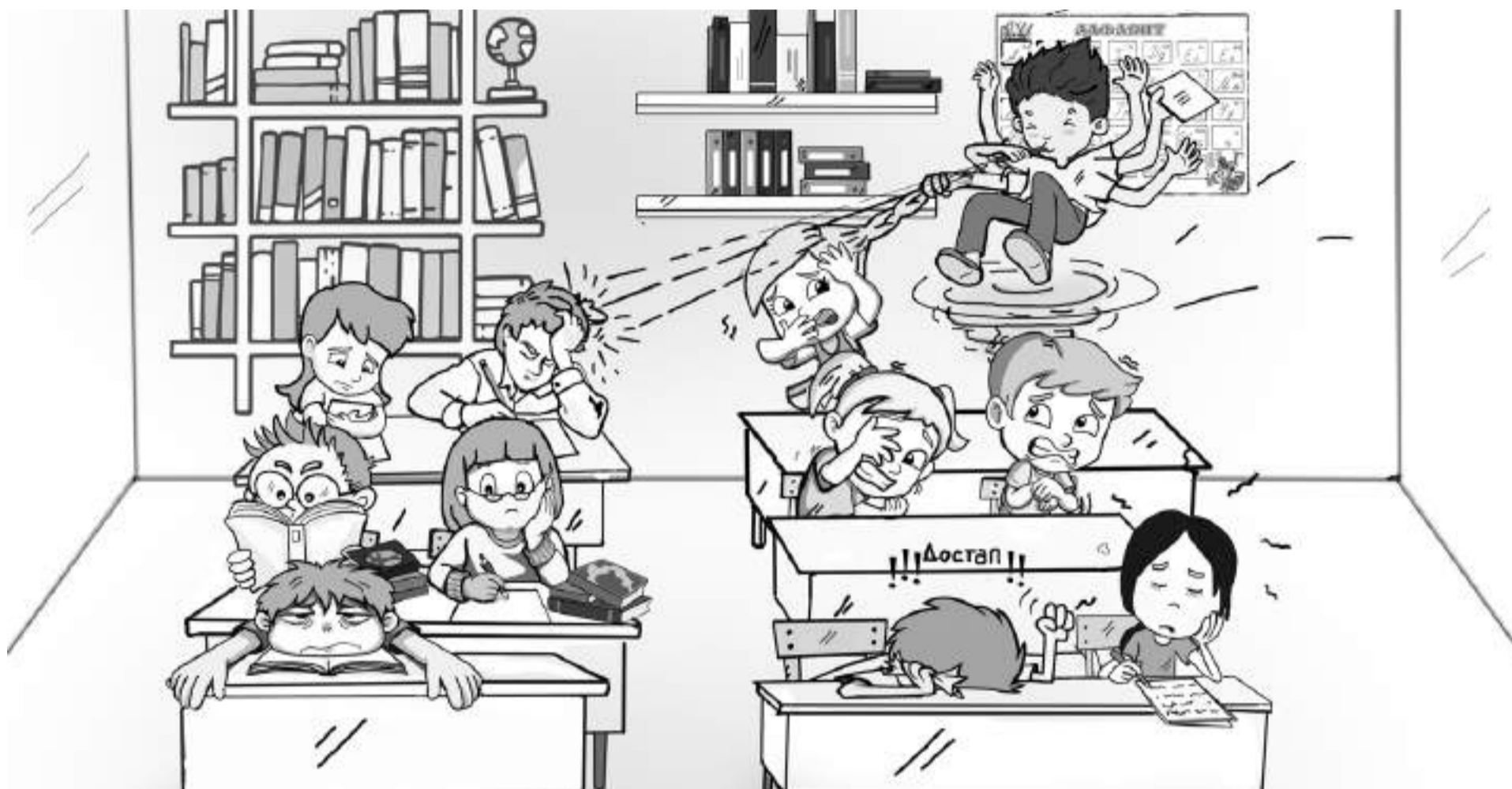
ИЛЛЮСТРАЦИЯ: ЕКАТЕРИНА КАСАКИНА

ПОЧЕМУ ШКОЛА ДОЛЖНА ПОМОЧЬ ТАКОМУ РЕБЁНКУ, А НЕ ПЕРЕКЛАДЫВАТЬ ОТВЕТСТВЕННОСТЬ НА ДРУГИХ