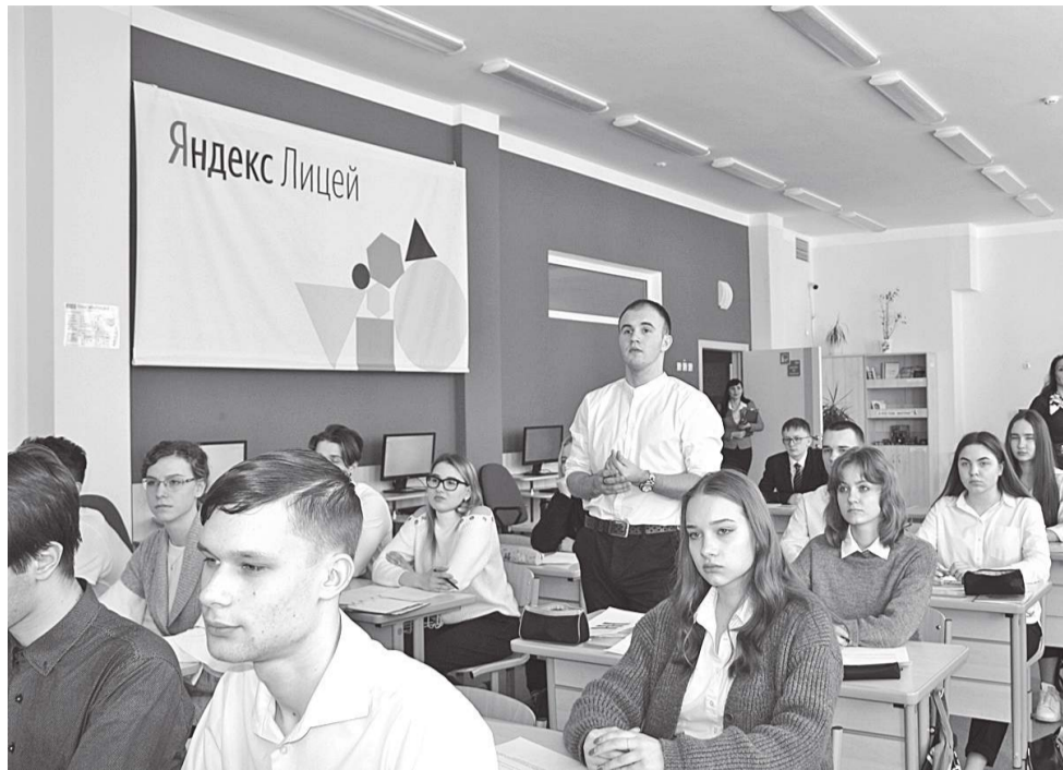
Урок информатики в IT-классе Центра образования № 15 «Луч»