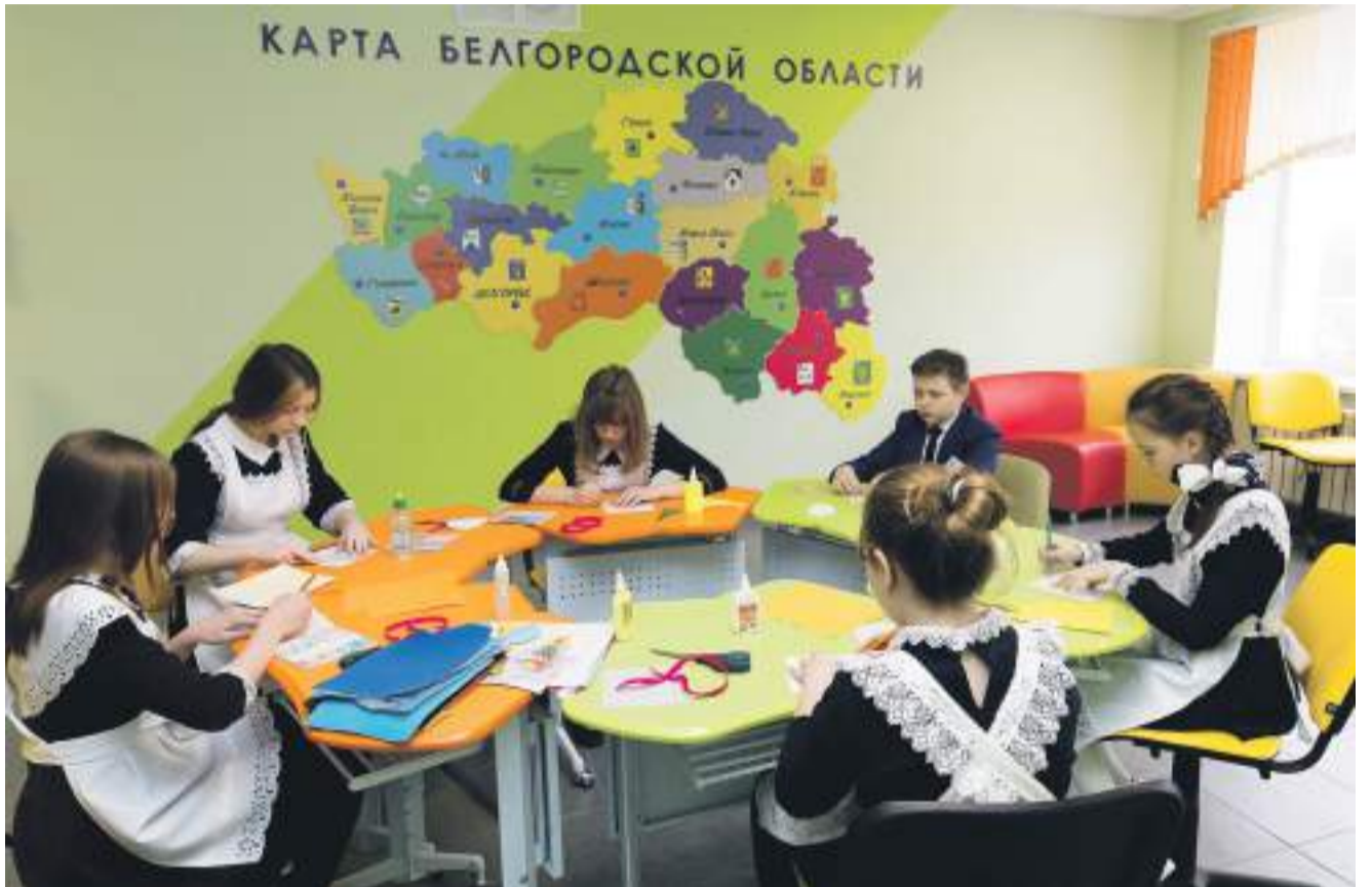
В коворкинг-зоне Крюковской школы ребята из изостудии делают пасхальную открытку