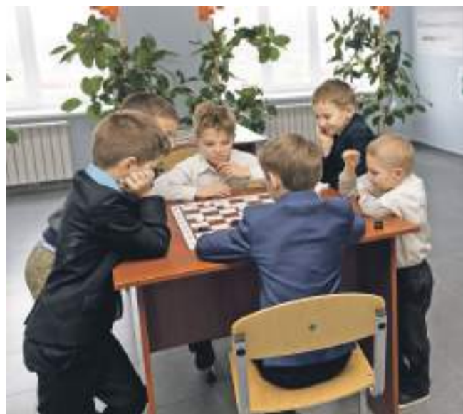
Шашечно-шахматная зона в Крюковской школе