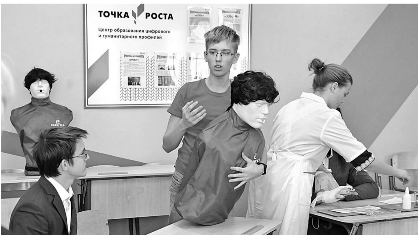
Оказывать первую помощь пострадавшим школьники учатся на манекенах-тренажёрах