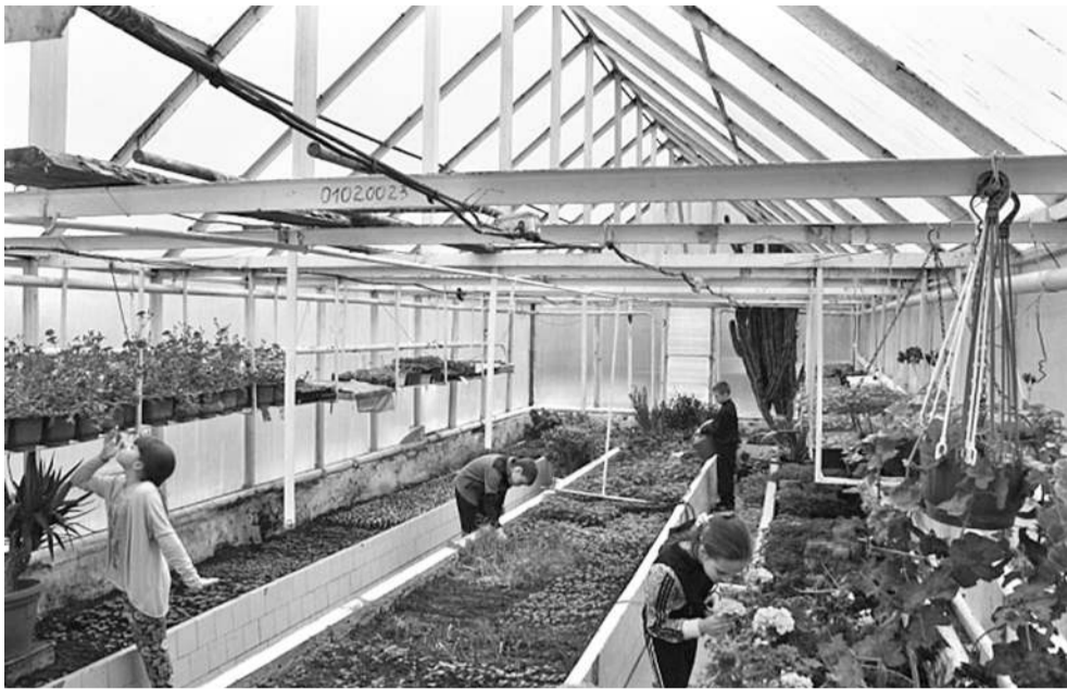
Школа имеет учебно-опытный участок площадью 0,75 га, где выращивают овощи и фрукты. В теплице зимой — зелень, весной — саженцы цветов

класса с современным оборудованием, шесть логопедических кабинетов, комната психологической поддержки, вокальная студия, спортивные и игровые площадки.