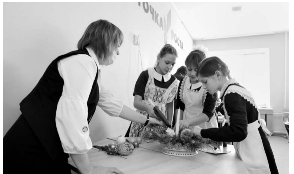
Девчонки из кружка «Станем волшебниками» за несколько минут создали новогоднюю композицию