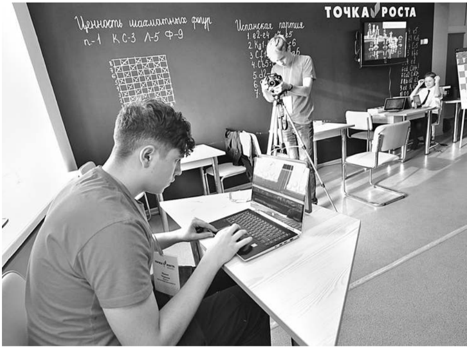
Школьная киностудия «Новое поколение»