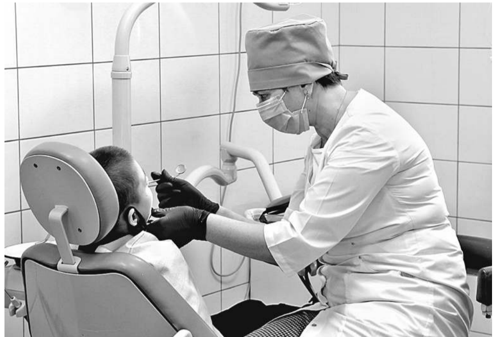
В лечебно-оздоровительном комплексе Корочанской школы-интерната оборудован стоматологический кабинет

Все дети в Корочанской школе-интернате с сохранным интеллектом, так что проблем с их социализацией нет. Но чтобы лучше подготовиться к взрослой жизни, участвуют в проекте «Уроки финансовой грамотности», а в рамках школьной программы на уроках технологии девочки учатся швейному делу (могут они и приготовить несложные блюда: салаты, оладьи, блины...), мальчишки в мастерских — столярному и слесарному. Ученики 10–11-х