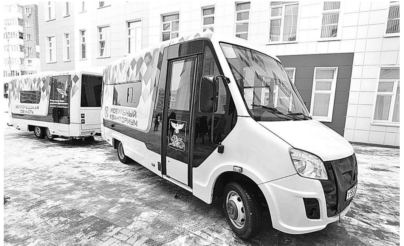
Мобильный технопарк «Кванториум»

КАК МОБИЛЬНЫЙ «КВАНТОРИУМ» ПОМОГ ОХВАТИТЬ ДОПОБРАЗОВАНИЕМ ТЕХНИЧЕСКОЙ НАПРАВЛЕННОСТИ УЧЕНИКОВ СЕЛЬСКИХ ШКОЛ