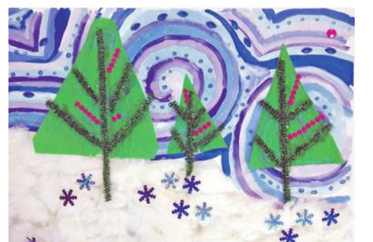
Коллективная работа объединения «Бумажные фантазии»