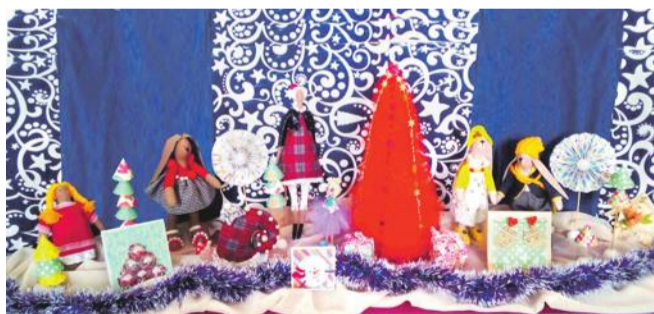
Подделки ребят из объединения «Умелые ручки»