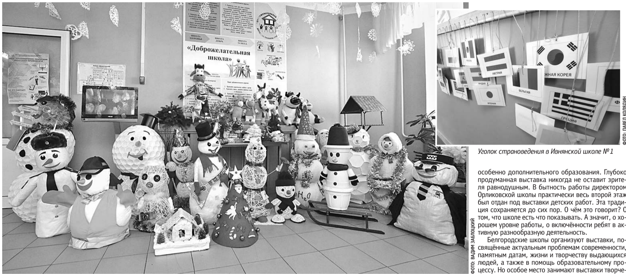
Оформление стен и рекреаций Гостищевской школы Яковлевского округа создаёт новогоднее настроение