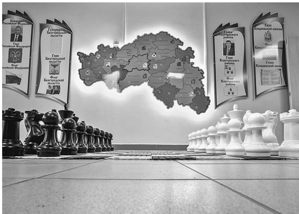
Оформление стен в Коцевова школе Корочанского района