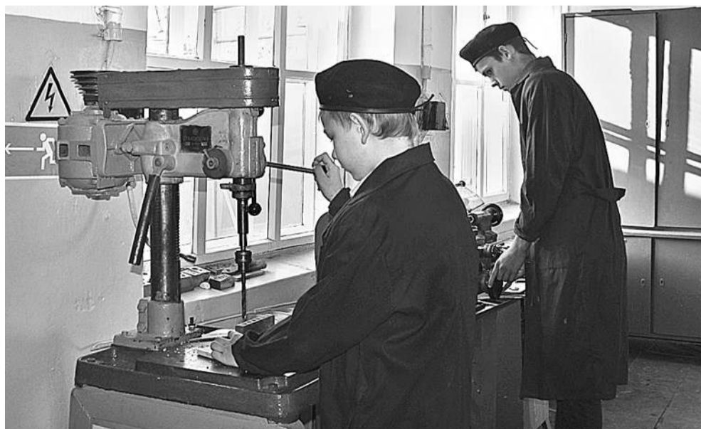
В школьной мастерской мальчишки учатся столярному и слесарному делу