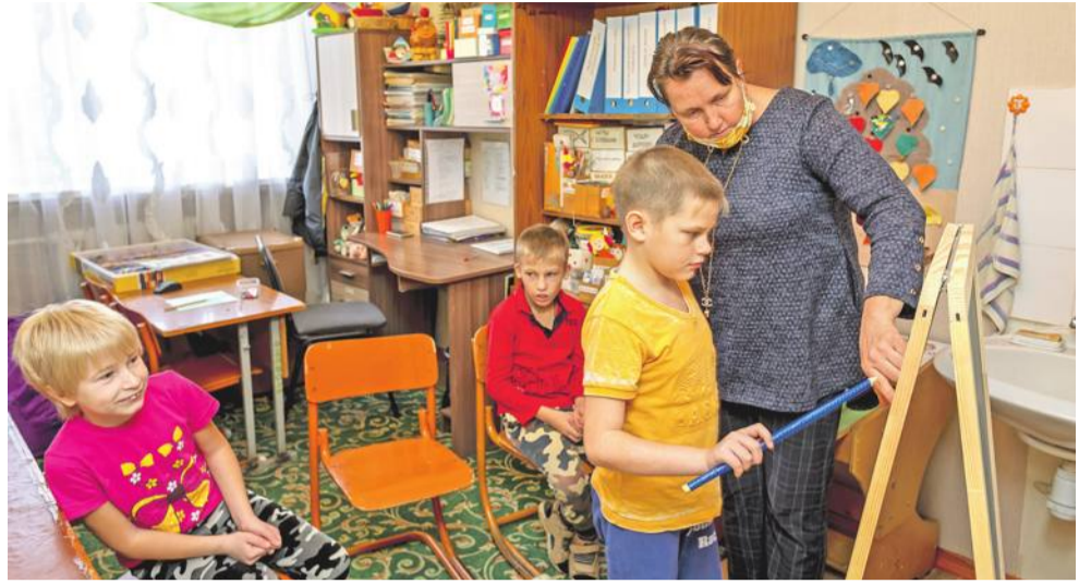
Творческие занятия на внеурочке