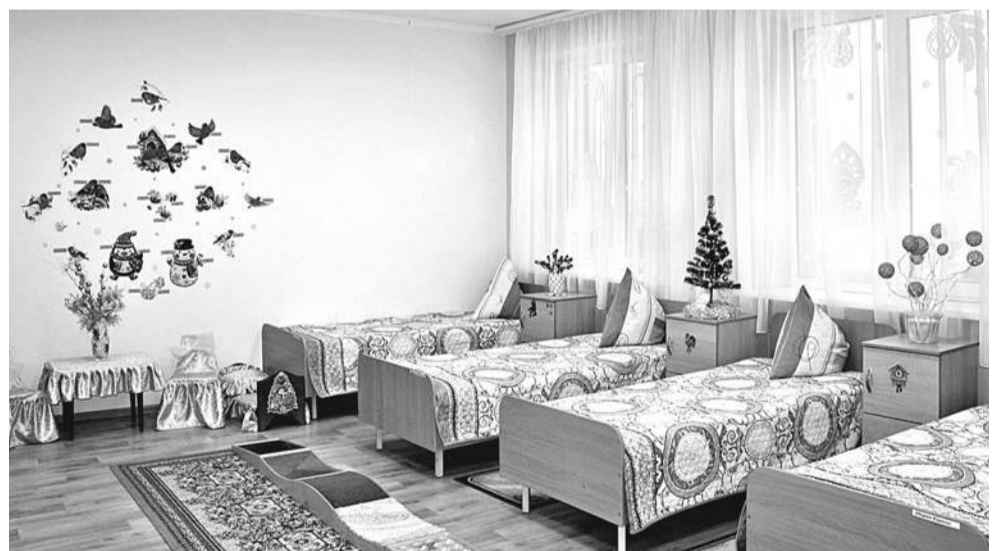
Спальная комната учеников начальных классов

классов ещё учатся в межшкольном учебном центре на водителей категории В.