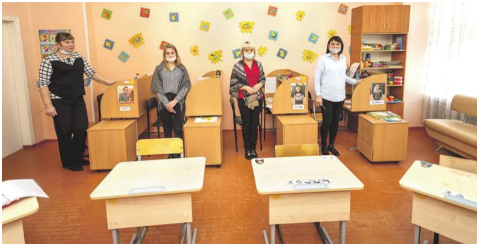
Тьюторы: каждый занимается с одним ребёнком с самыми тяжёлыми проблемами со здоровьем