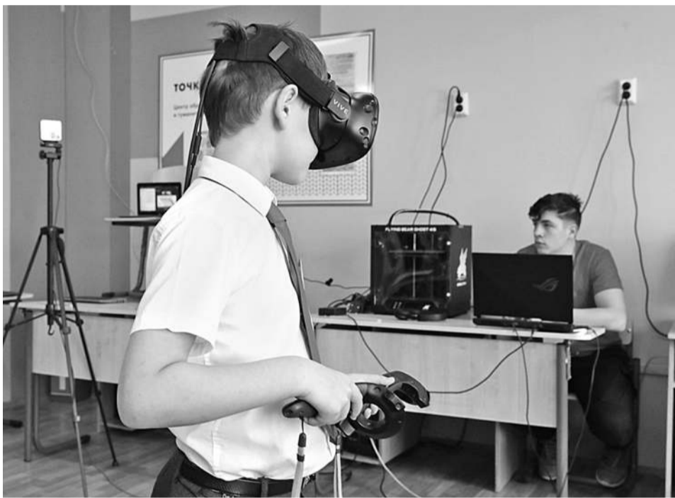
Путешествие вглубь лёгких с помощью очков виртуальной реальности

Старшеклассники Гостищевской школы раз в неделю на математике занимаются на платформе «Учи.ру». На внеурочке этот ресурс тоже активно используется. Нам показали одно из таких занятий: школьники выполняли на ноутбуках задания пробного тура олимпиады Vicsmatch.com+.