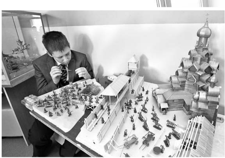
Вот такой макет старинной крепости ребята сделали своими руками