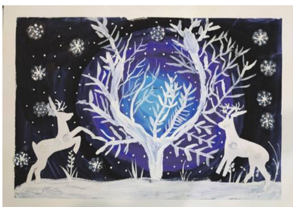
«Зимняя сказка». Рисунок Алексея Чудных (руководитель Дина Кислиця)