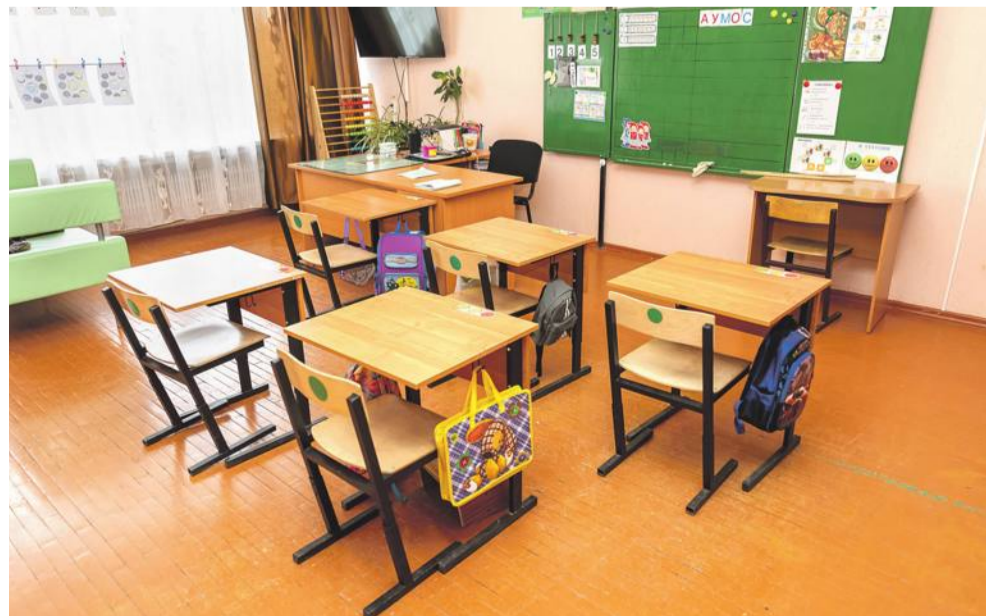
Класс для учеников с тяжёлыми интеллектуальными отклонениями

Слово «социализация» — слишком серьёзное, безликое, официальное. Но означает оно очень многое. Фактически — всю жизнь ребят в школе-интернате. Многие «особенные» дети совсем по-другому