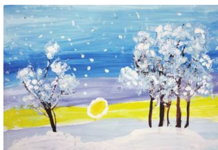
«Снег». Рисунок Юрия Кривокустава (руководитель Дина Кислиця)