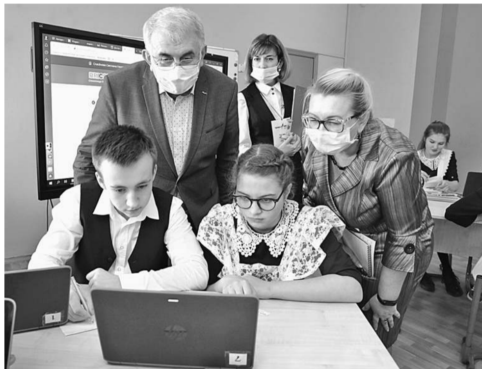
Решать олимпиадные задачи на платформе «Учи.ру» интересно и полезно!