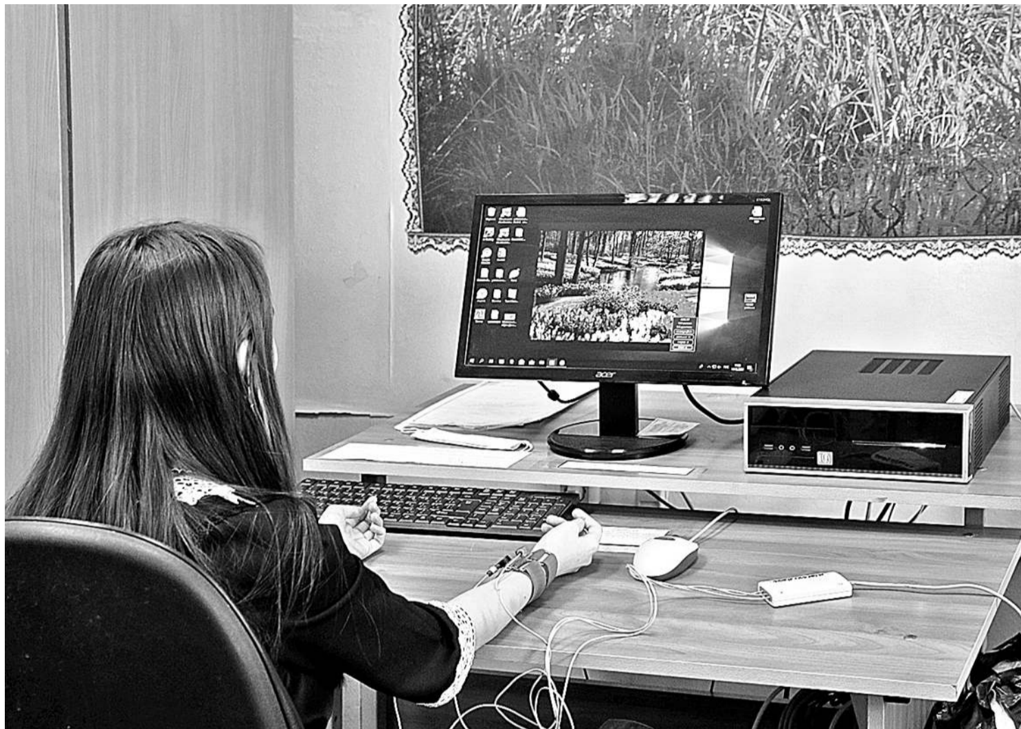
На занятии в кабинете БОС-здоровье

КАК КОРОЧАНСКАЯ ШКОЛА-ИНТЕРНАТ ДАЁТ ПУТЁВКУ В ЖИЗНЬ ДЕТЯМ С НАРУШЕНИЯМИ РЕЧИ