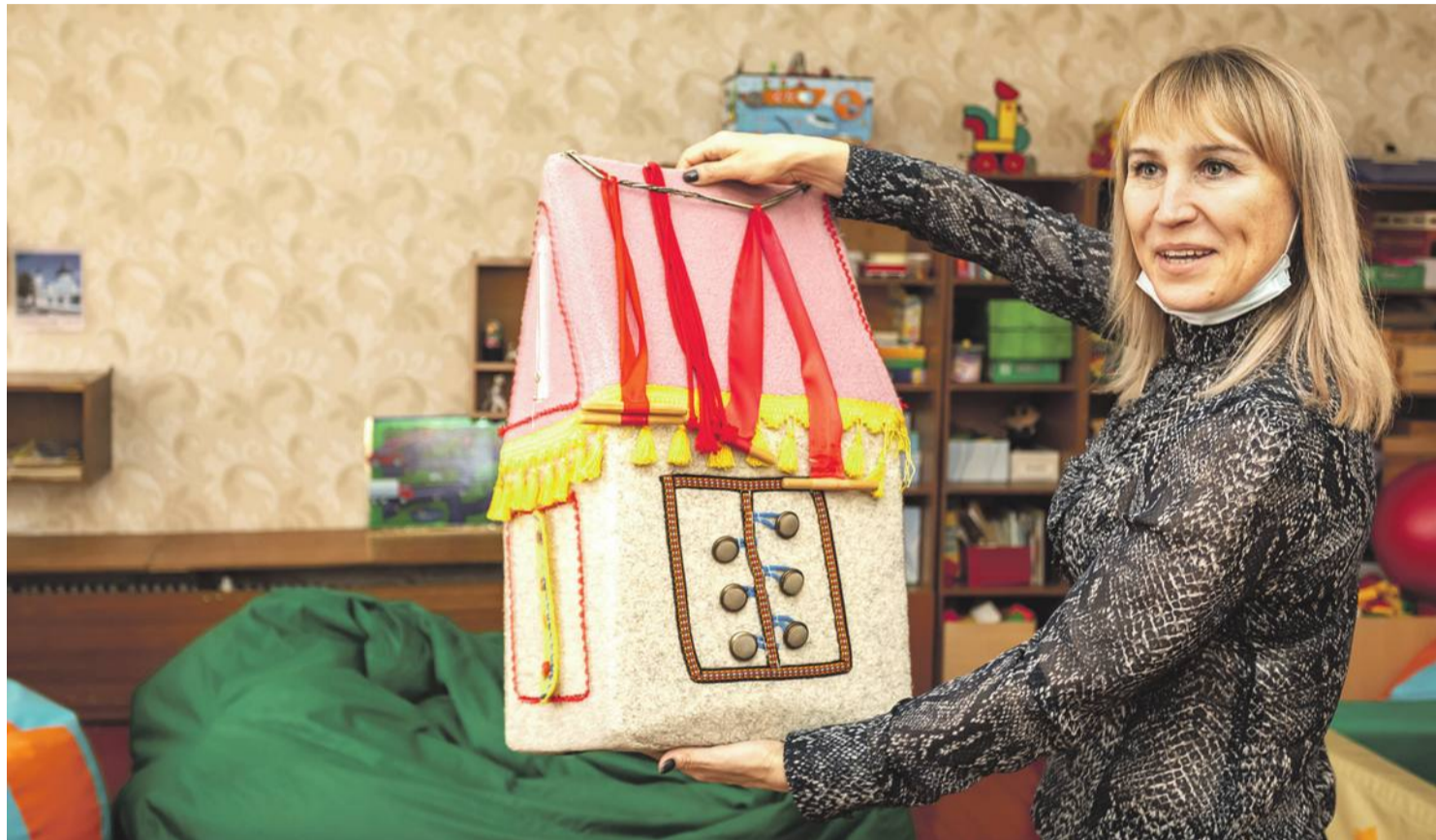
Оборудование для развития мелкой моторики

ПОЧЕМУ В НОВООСКОЛЬСКОЙ ШКОЛЕ-ИНТЕРНАТЕ РЕБЯТАМ ХОРОШО ТАК ЖЕ, КАК ДОМА