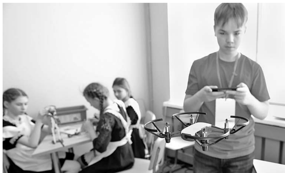
Запуск квадрокоптеров — любимое занятие мальчишек