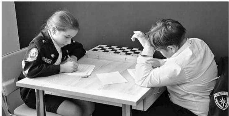
Рассчитать ценность шахматных фигур — задача нелёгкая