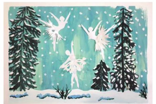
Коллективная работа объединения «Бумажные фантазии»