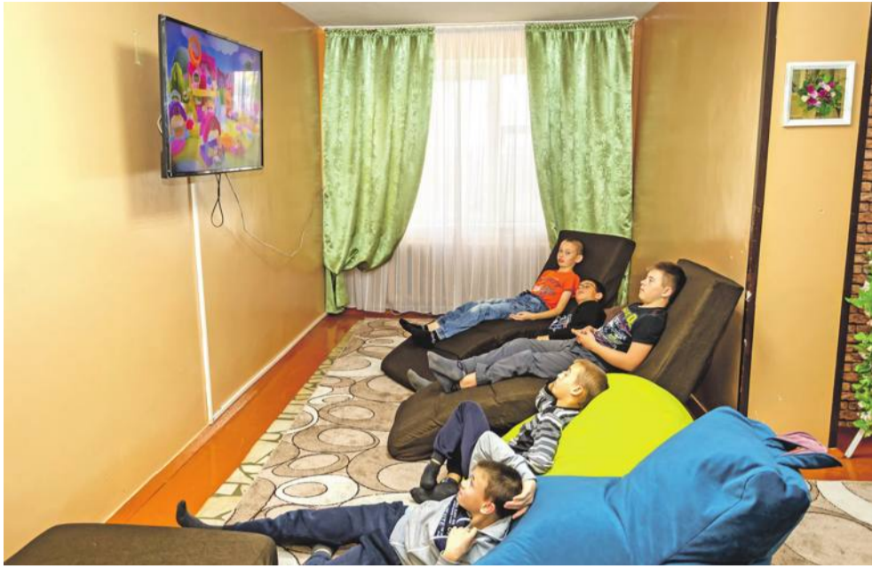
В свободное время можно посмотреть телевизор