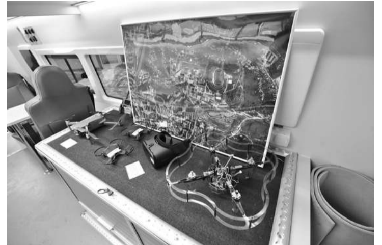
Мобильный «Кванториум» «начинён» современным оборудованием

Планируется, что воспитанники мобильного «Кванториума» будут получать реальные задания от местных предприятий и компа-