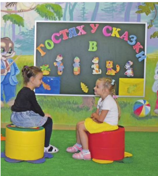
В детском саду № 4