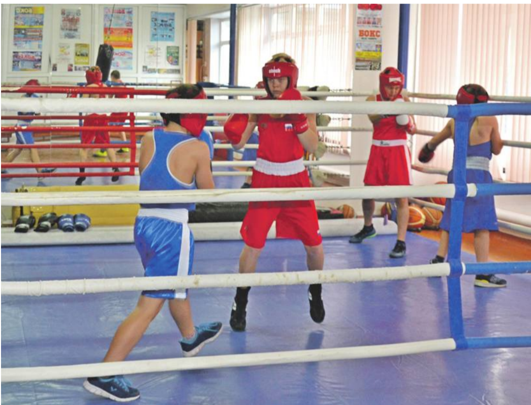
Тренировки по боксу в школе № 4