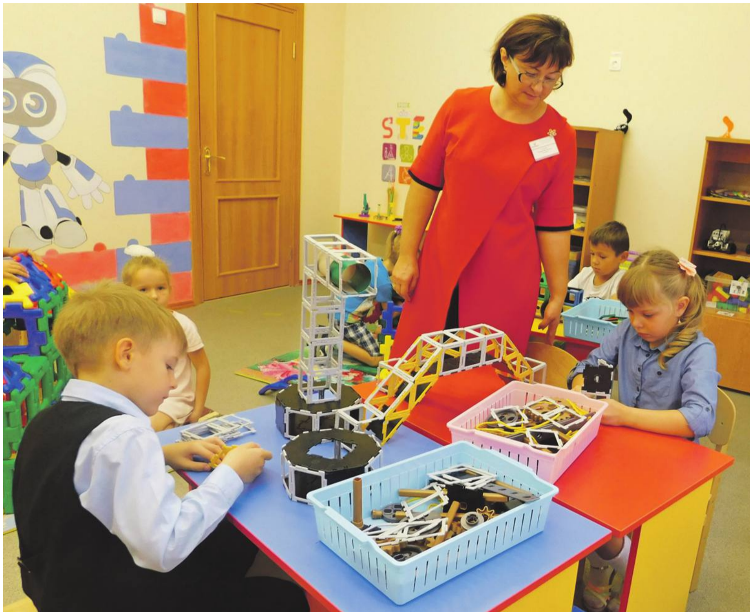
Инженерное образование малышей начинается с конструирования

Школьный технопарк позволяет создать эффективную систему профориентации, популяризовать среди школьников и их родителей востребованные инженерные и технические специальности. И, конечно, помогает выявить «техно-звёздочек» среди учеников в сетевом взаимодействии образовательных учреждений города.