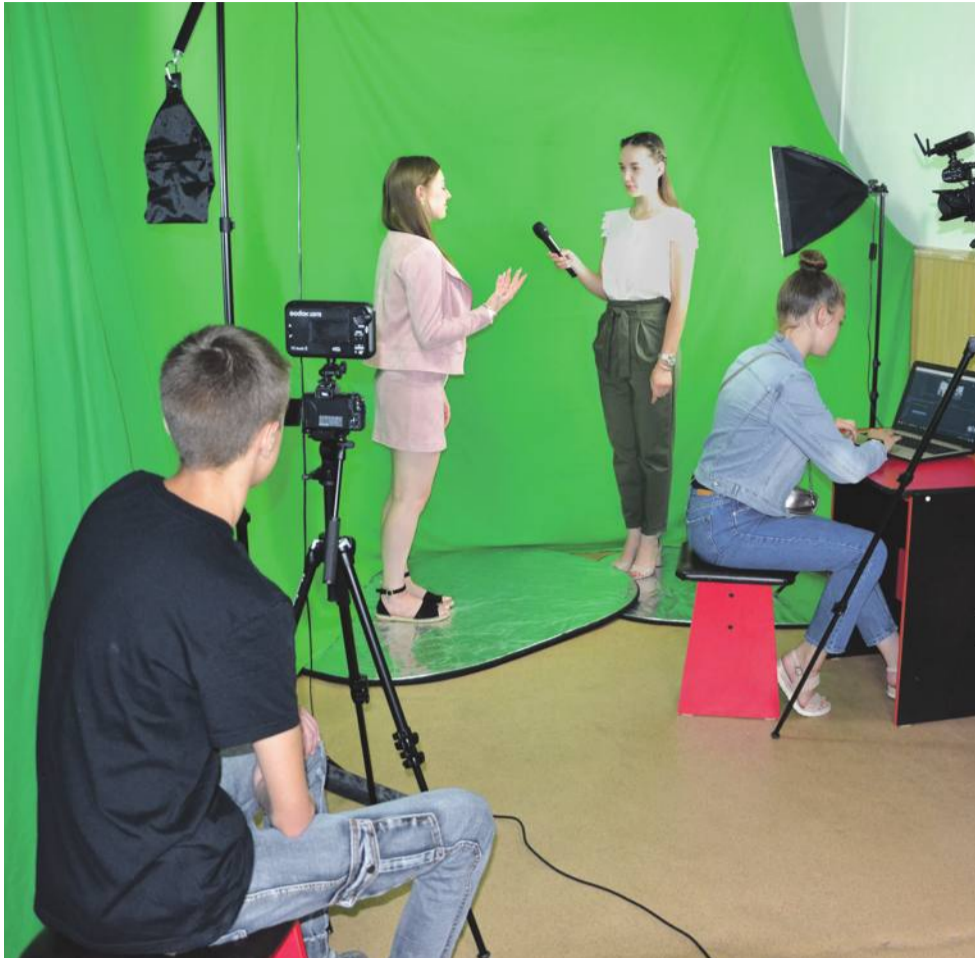
В школьном медиацентре «МедиаДикт» школы № 1