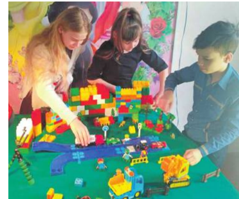
Студия мультипликации в Доме детского творчества