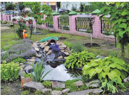
Ландшафтный дизайн на территории школы № 2