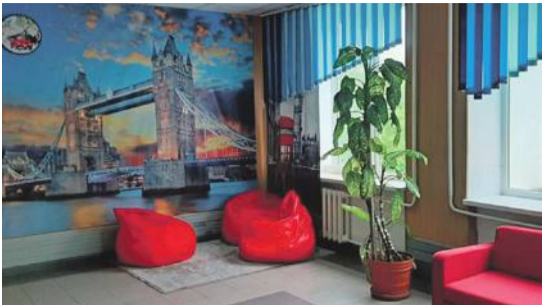
Рекреационная зона в школе № 1