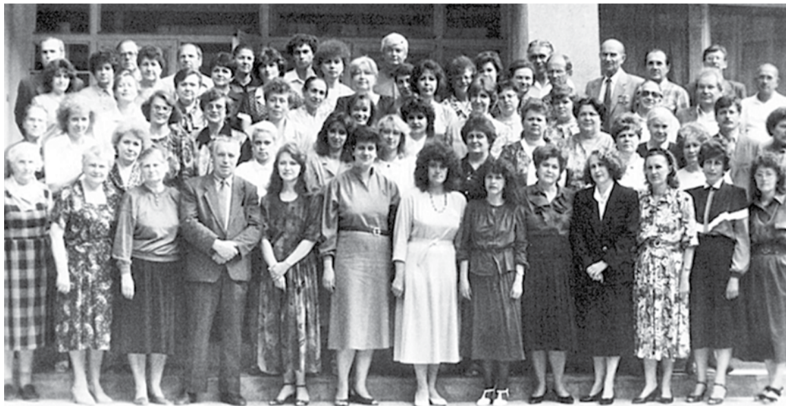
Коллектив Белгородского областного института усовершенствования учителей, 1994 год

Благодаря профессионализму, преданности своему делу, большому трудолюбию, таланту преподавателей, педагогов институт развивался, успешно выполняя свою главную миссию — повышать качество образования Белгородской области. Сегодня наш институт обладает высоким потенциалом, компетентным и работоспособным профессорско-преподавательским составом, который полон творческих планов и замыслов. Надеюсь, что всё это позволит нам эффективно реализовывать как региональные, так и федеральные инициативы. Желаю всем преподавателям и сотрудникам Белгородского института развития образования радости, профессиональных побед, счастья и любви близких, душевного равновесия, интересного и плодотворного учебного года!